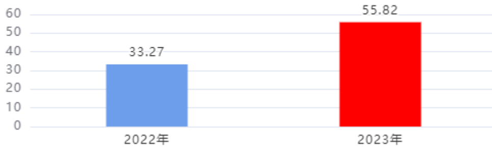
财政拨款收入、支出总计对比图（单位：万元）